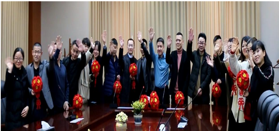
图表 5 董事长兼总经理携全体主管向 2019 年度优秀员工及其家属视频拜年

e) 公司通过树立标兵、通报表彰、颁发荣誉证书等形式鼓励员工，从而增强了员工凝聚力和向心力，创造了更高的绩效。