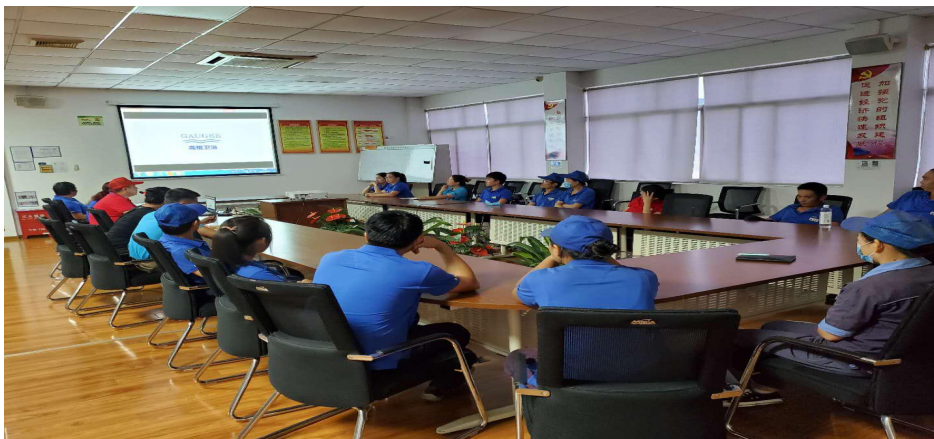
图表 1 新员工品质能力提升培训

企业只有在质量意识的教育和活动中，培养职工的团队精神，才能真正把全面质量管理落到实处，才能让企业质量意识的得到贯穿和提高。