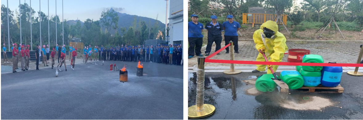
图表 6 应急演练

e) 公司对安全问题时刻不松懈。公司制定事故等紧急救援预案，对现场邀请专家、安监部门来公司进指导，每年举办与举行消防安全知识培训和消防演习。设有专职的安全员每天到生产现场进行安全巡查，发现安全隐患快速反馈职能部门并及时整改。